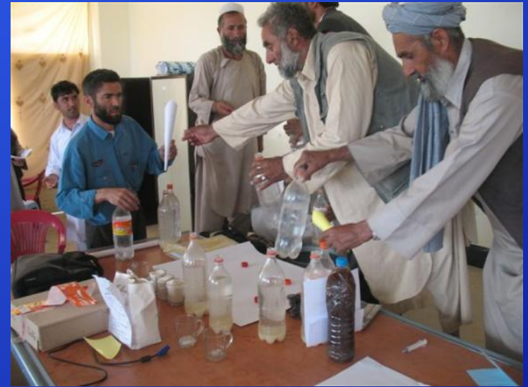
تهیه کود حیوانی

• همه مسئولیت های کاروبار از مسئولیت های مالک کاروبار شمرده می شود.