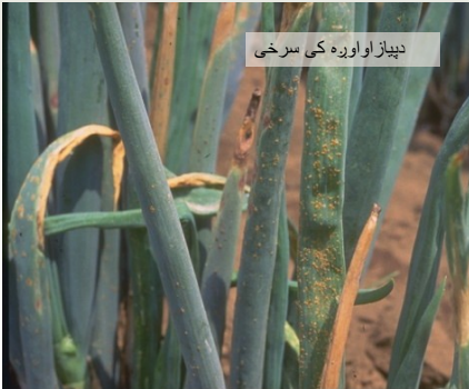
دپیاز او اوره کې سرخی