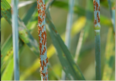
دساقی سرخی په غنمو کې