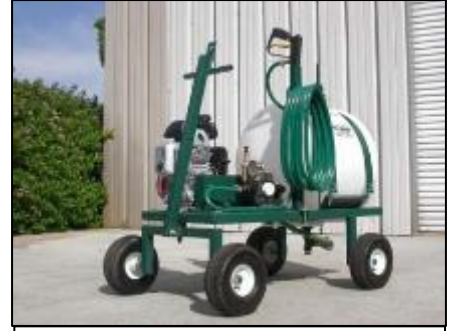
د بي بي ايم شرکت څلور اربه بیز درمل پاشونکی ۱

څلور اربه بیز | گادی ډوله درمل شیندونکی د افت ضد درملو هغه کوچني، گرځنده، او په موټوري پمپ سمبال درمل شیندونکی دي چې له کوچنيو څخه نیولې تر منځنيو کروندو او باغونو لپاره پوره مناسب دي. دغو دواپاشونکو ته په لاس یا د باغ د تراکتور په واسطه حرکت ورکول کېږي، او په آسانی سره د یوه یا دوو کسانو په واسطه د استعمال وړ دي.