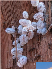
Ants tending vine mealybugs in early spring