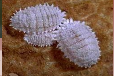
Vine Mealybug Note lack of filaments