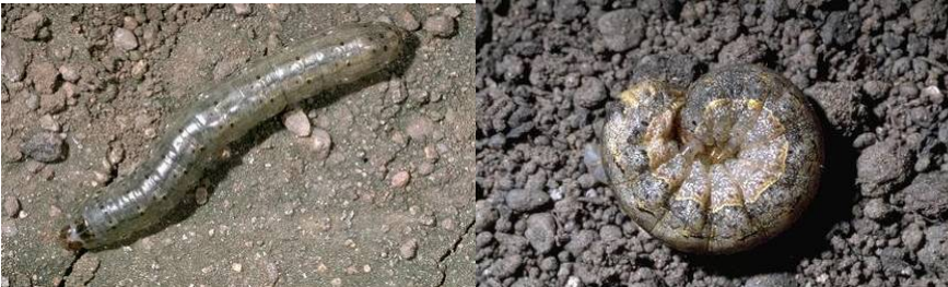
Figure 11.2: Black Cutworm ( Agrotis ipsilon ) and Variegated Cutworm ( Peridroma saucia )

په مني کې ددی حشراتو نفوس ډير زيات وي او په تيغو باندې ډير خراب تاثير لري. د هگي څخه نوي راوتي لاروا په موقته توگه په پانو باندې تغذيه کوي، او بيا ځمکې ته رالويږي او لاندې ځمکې ته ننوځي. لاروا يې په شپه کې راوړي او د گلپيانو په تيغو باندې تغذيه کوي. دا چينجي په گلپيانو داسې حمله کوي چې ساقه يې د ځمکې د سطحې سره پرې کوي. دا ډول يو چينجي په يو ماښام باندې څو بوټي تخريبولای شي. او که نفوس يې ډير وي نو د گلپيانو ټول ولاړ فصل تباہ کولای شي.