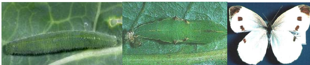
11.4 شکل: د کرم د پتنگ د ژوند د دوران مرحلې: لاروا – پوپا- کاهل يا غټ شکل

ددې پتنگانو لاروا په پانو کې غټ، غیرمنظم سوري وکارې. کله چه په ځوانو نباتاتو حمله وشي، نو لاروا نبات وژلې شي او يايې د ودې مخه نيسي. پخواني بوټي کولای شي چه د لاروا د تغذيې په مقابل کې ډير تحمل ولري نظر ځوانو بوټو ته. لاروا د ۲-۳ اونيو پوري تغذيه کوي او بيا ځان د ساقي يا پاني يا داسې بل شي پوري نينلوي ترڅو په پوپا تبديل شي. د گلپي په سر کې د لاروا او يا د لاروا د موادو شتون، او يا تخريب باعث ددی کيږي چه بازار کې هماغه گل نه خرڅيږي.