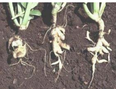
Figure 11.4: Club root on cole crops

اقليمونو كې ليدل كيږي. اخته شوي ريشي غټيږي، انحراف كوي او د club يا لوبو د لرګي شكل نيسي. د اخته شوي نبات په ريشو كې دا ناروغۍ وسيع او پراخه كيږي، مخكي لدينه چه د ځمكې دپاسه نبات علامې وښيي. د اخته شوي نبات پاتې ژيريري، مراوي كيږي او وژل كيږي.