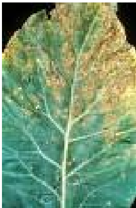
Figure 11.3: Downy mildew symptoms

گلپي په يو شمير ناروغيو اخته كيدي شي چه بايد كنترول شي ترڅو د خپلي خوښي حاصلات د كميت او كيفيت له نظره ترلاسه كړو. مخكي لدينه چه د ناروغيو د كنترول لپاره هره فنګس وژونكي دوا استعمالوي، بايد په ليل باندې يې لارښوونې ولولي.