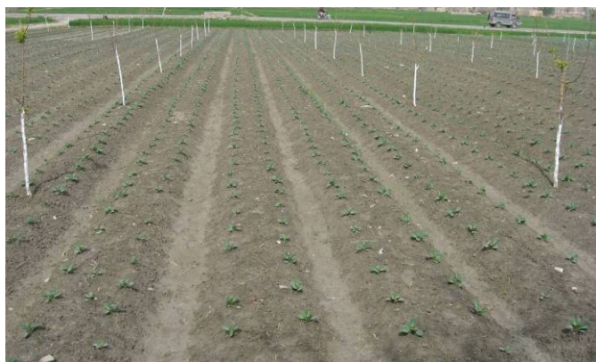
Figure 11.1: د گلیپو فصل، چه ونی پکی ایښودل شوي

پتي باید د ۲۵ سانتي په ژوروالي سره قلبه شي او بیا هوار شي. بوز غلی باید سهار وختي او یا ماسپینین ناوخته وکرل شي ترڅو د ورځي د گرمی نه بچ شي. د بوز غلیو د کښت څخه دمخه، د تیغو ریشي شاید د Bavistine (دوه ګرامه په یو لیتر اوبو کی) په محلول کی غوټه شي.