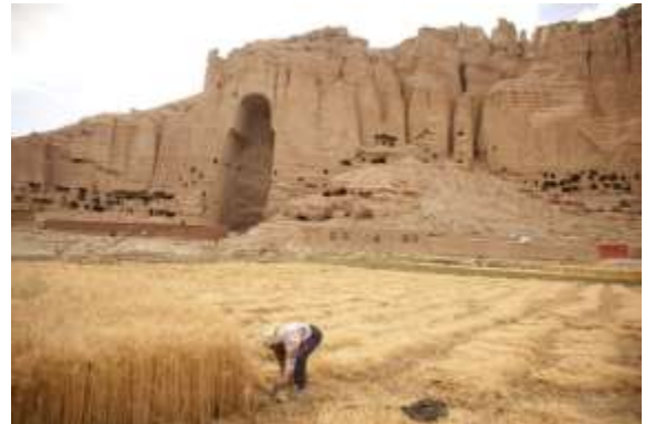
شکل 1. غنم په بامیان کېښی.

په افغانستان کېښی غنم یو د توجه وړ او عنعنوی محصول گڼل کیږی (شکل 1). او د ټولو افغانانو لپاره یوه ډیر اړینه او عمده خواړه شمیرل کیږی. معمولاً د افغانستان په هر ولایت کېښی غنم په لومړی قدم کېښی د خپل مصرف او خونديتوب لپاره کرل کیږی (شکل 2). غالباً غنم په افغانستان کېښی د 2.7 څخه تر 3 میلیونه هکتاره پوری له نورو غله جاتو سره لکه اوربشی، جوار، او وربخی او نورو مهم غله جاتو یوځای کرل کیږی